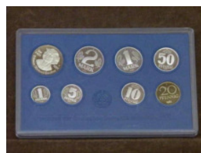
Versteigerung von DDR-Münzen, 15.06.1990

TrickReich - Animationsfilmreihe auf 3sat vom 20. bis 29. Juli 2010; ESTERHAZY am 23. Juli ab 0:20 Uhr